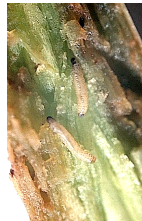
Larves de grosse altise (Cetiom)